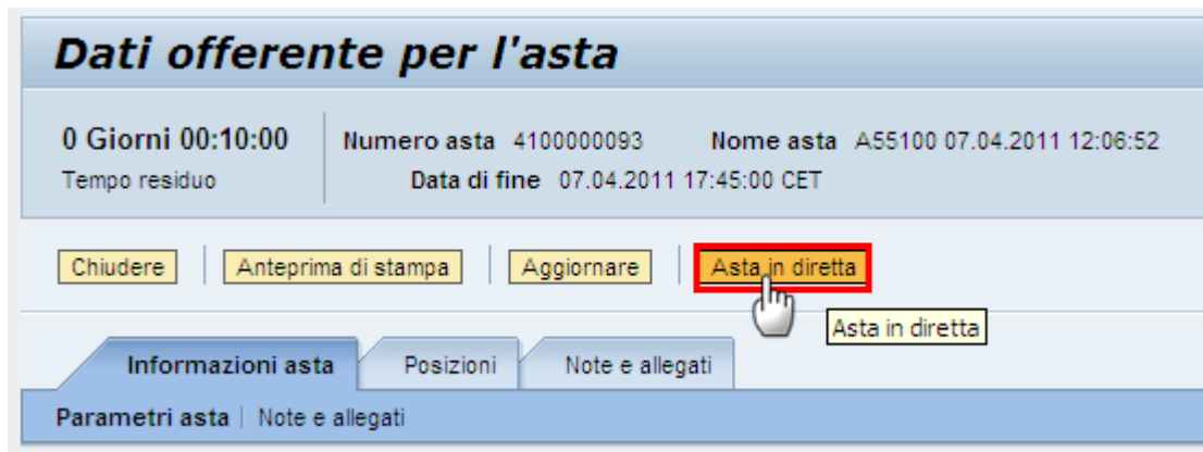
Figura 3: Accesso Asta in diretta

Dal dettaglio del documento è possibile aprire la finestra di “Asta in diretta”