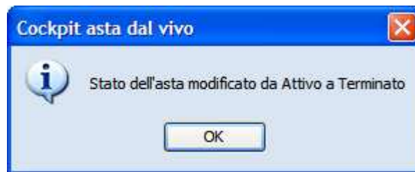
Figura 7: Chiusura asta

Al termine dell'asta viene visualizzato un messaggio in popup.