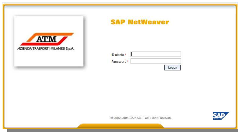
Figura 1: Schermata di Accesso

Il fornitore accede al sistema SRM tramite browser internet. L'accesso richiede l'identificazione tramite "ID Utente" (Utenza dell'utente) e "Password". Dopo l'inserimento dei dati suddetti, premere sul tasto "Logon" per accedere alla pagina iniziale.